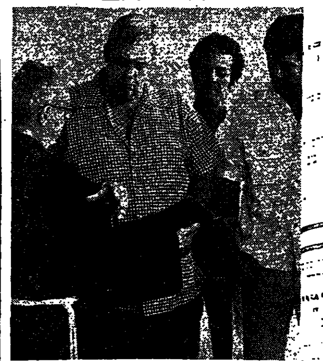
חברי התנועה האקולוגית והחברתית "חצור הגלילית" מתנגדים להקמת מפעל מלט ליד חצור הגלילית. הם דורשים להפסיק מיד את ההקמת המפעל ולבטל את היתר הבנייה.

וששים מהתנוות מיטרד אקולוגי התנגדות חריפה למפעל מלט ליד חצור הגלילית התחילה השבוע. התנועה האקולוגית והחברתית "חצור הגלילית" התנגדת להקמת מפעל מלט ליד חצור הגלילית. התנועה טוענת כי המפעל יגרום לזיהום סביבתי, יפגע בבריאות תושבי האזור ויגרום לנזק ארוכת טווח לסביבה. התנועה דורשת להפסיק מיד את ההקמת המפעל ולבטל את היתר הבנייה.